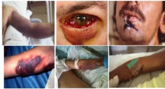
برخی از مهم‌ترین علائم بالینی بیماری

رحم در موارد شدید و مرگبار بیماری مشاهده می‌شود.